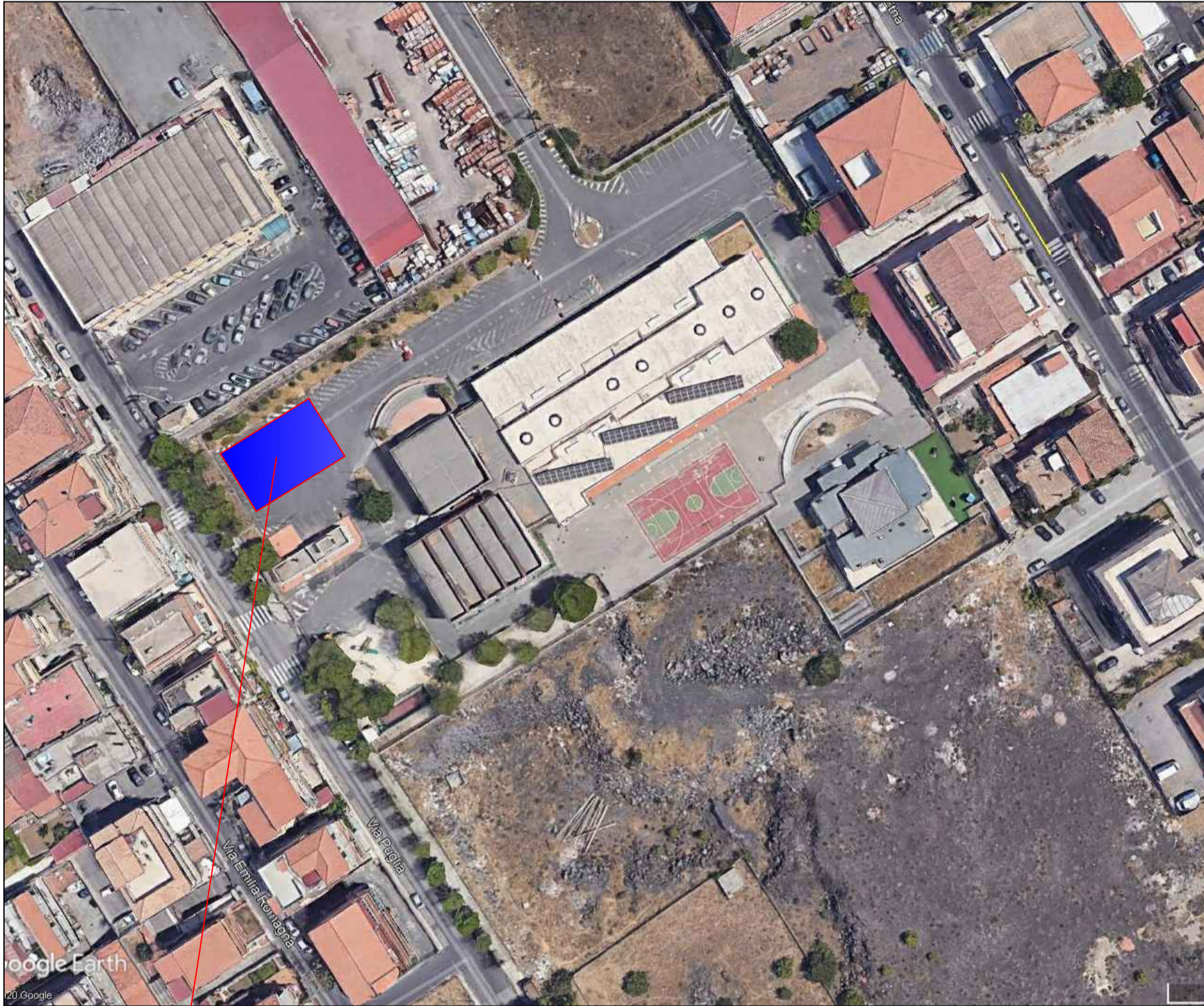
ubicazione del modulo di tipo "A" presso l'I.C. Leonardo Sciascia